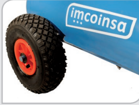
Ruedas Neumáticas Facilitando la rodadura.

Completa y eficaz solución de aire comprimido para su utilización en instalaciones donde no se disponga de suministro eléctrico (vehículos de reparación, sector agrícola, eventos, etc.).