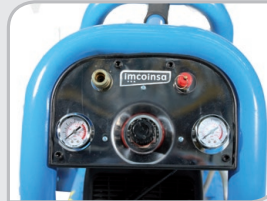
Panel de mando frontal Simplifica utilización del equipo