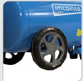
Fácil manejo y transporte Ruedas extra-grandes y doble apoyo en la parte delantera.