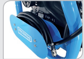
Enrollador de manguera. (Manguera no incluida)